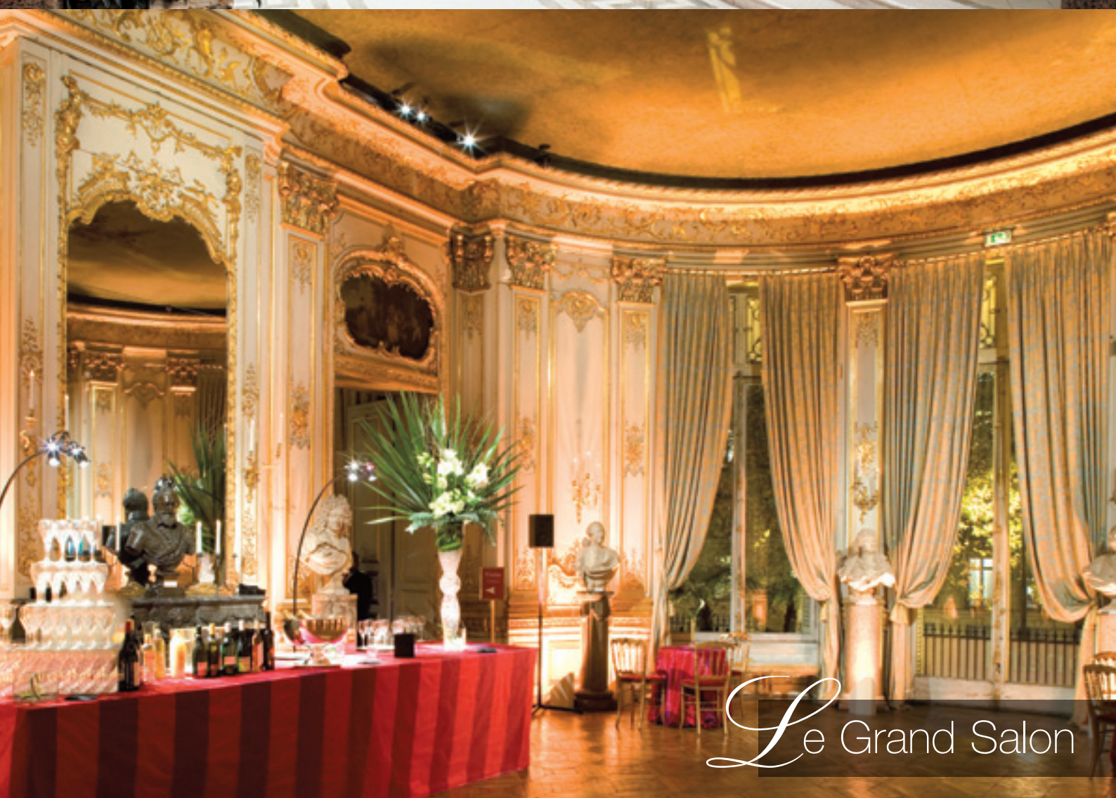
Le Grand Salon