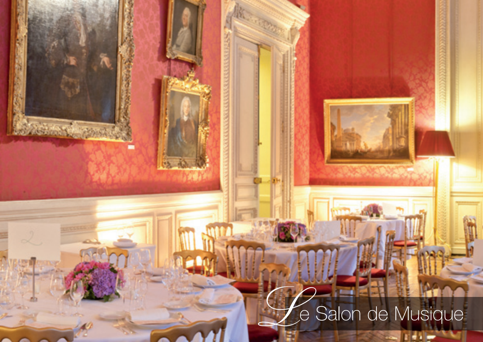
Le Salon de Musique