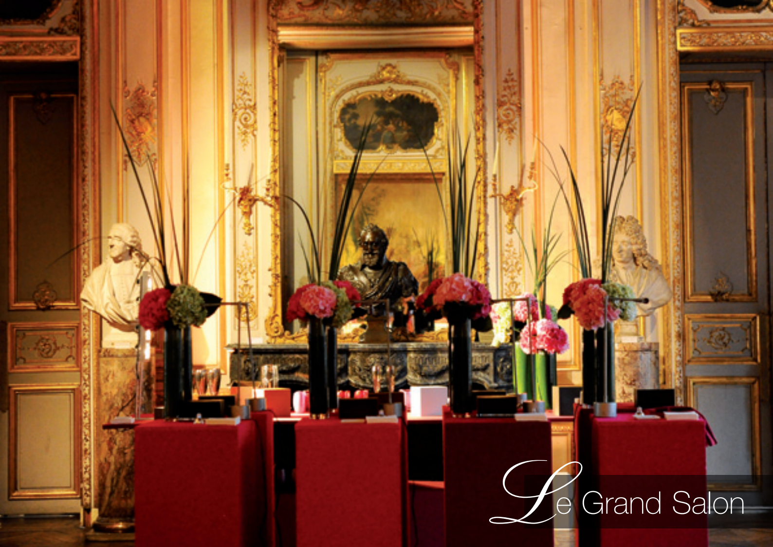
Le Grand Salon