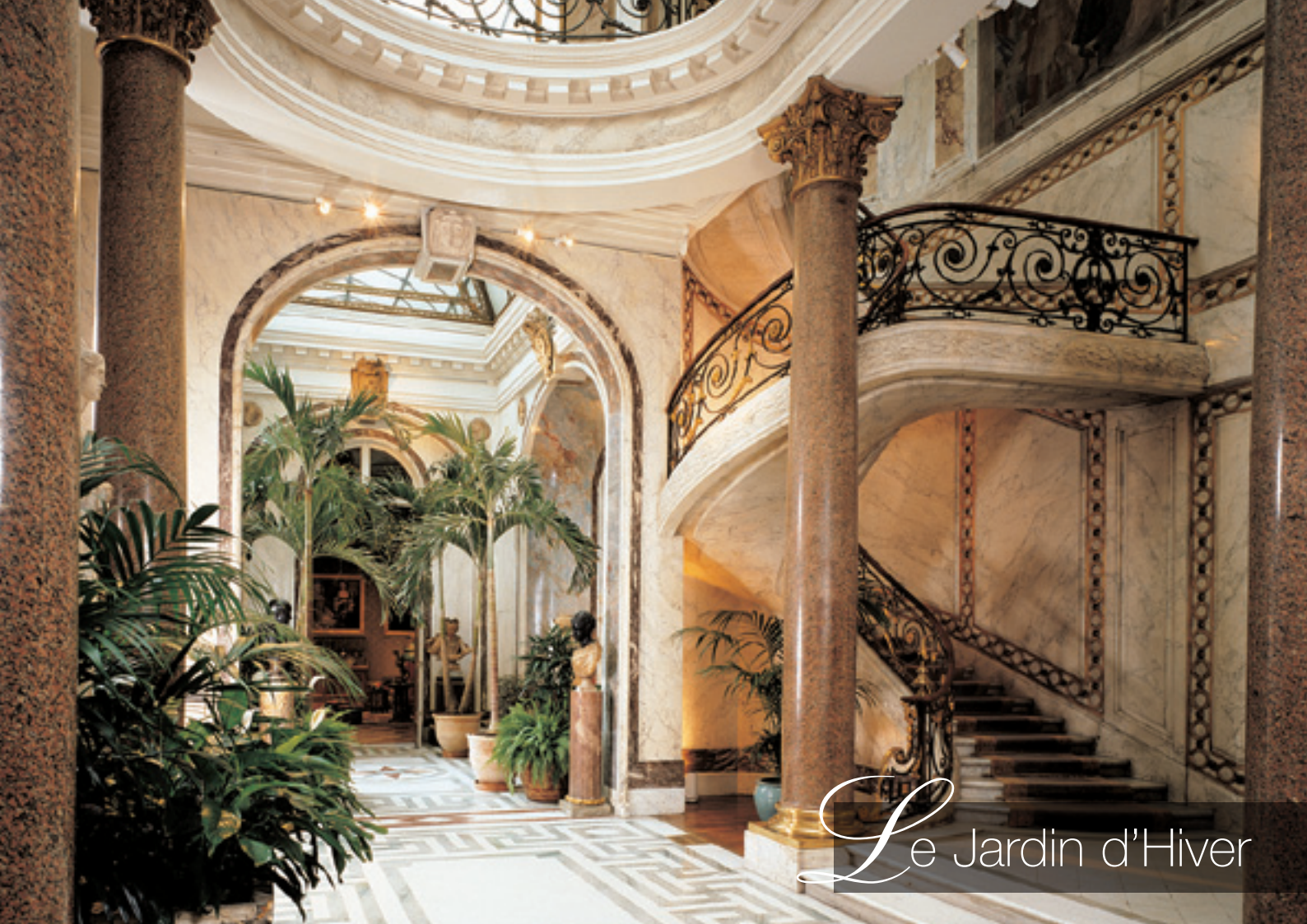
Le Jardin d'Hiver